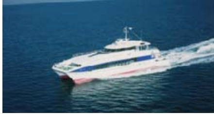
【시카노시마 항로 : 긴인 1·2】