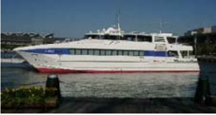
【하카타만 크루즈 : 긴인3】