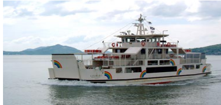
【노코 항로 : 레인보우 노코】