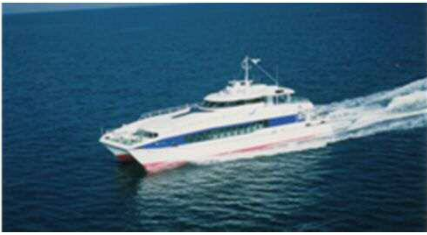
【시카노시마 항로 : 긴인 1】