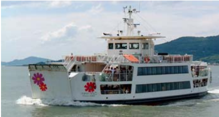
【노코 항로 : 플라워 노코】