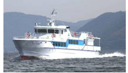
【겐카이시마 항로 : 미도리 원】