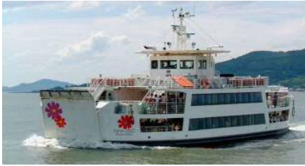
【노코 항로 : 플라워 노코】