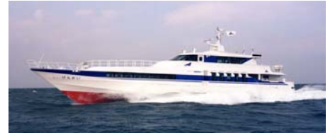
【겐카이지마 항로 : 뉴 겐카이】