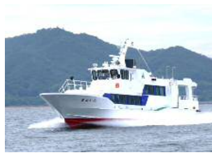
【시카노시마 항로 : 긴인】