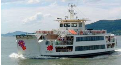
【能古航路:フラワーのこ】