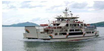
【能古航路:レインボーのこ】