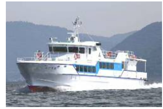
【玄界島航路:みどり丸】