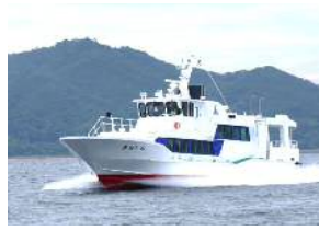
【志賀島航路:きんいん】