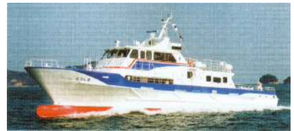
【小呂島航路:ニューおろしま】