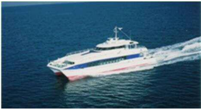
【志賀島航路:きんいん1】