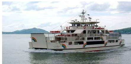
【能古航线：彩虹能古号】