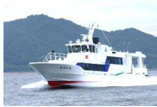
【志贺岛航线：金印号】