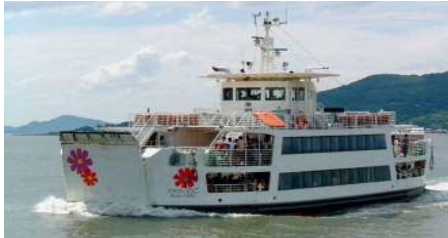
【能古航线：鲜花能古号】