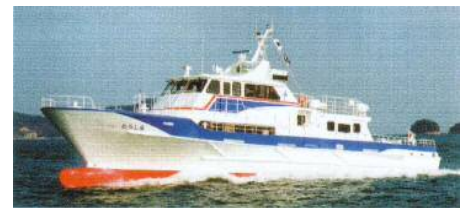
【小吕岛航线：新小吕岛号】