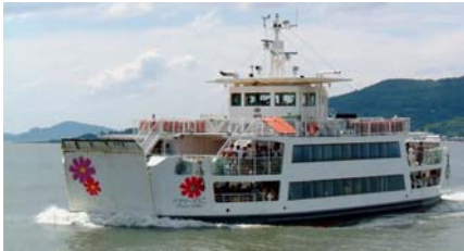
【노코 항로 : 플라워 노코】