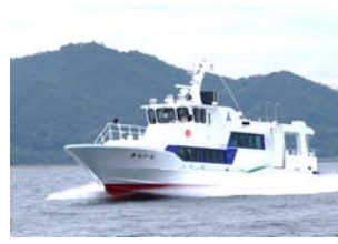
【시카노시마 항로 : 긴인】