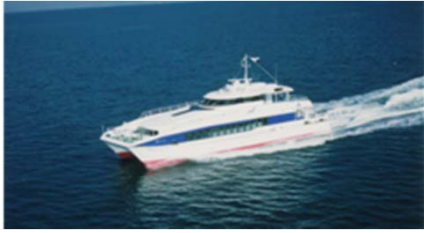
【시카노시마 항로 : 긴인 1】