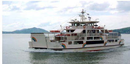
【노코 항로 : 레인보우 노코】