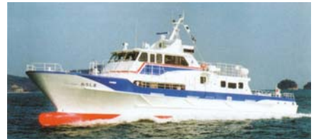
【오로노시마 항로 : 뉴 오로시마】