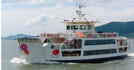
【能古航线：鲜花能古号】