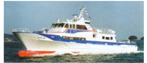
【小吕岛航线：新小吕岛号】