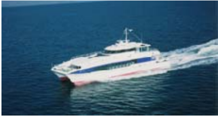
【志贺岛航线：金印1号】