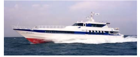
【玄界航线：新玄界号】