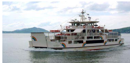
【能古航线：彩虹能古号】