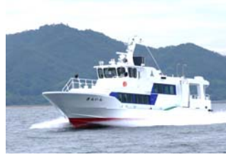
【志贺岛航线：金印号】