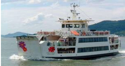
【能古航路:フラワーのこ】